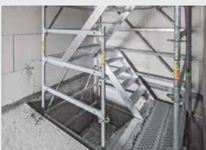
Bau- und Ausbautreppen